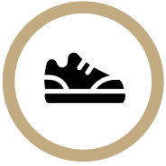
실내용 운동화 착용