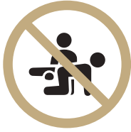
외부인 티칭 불가