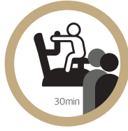
웨이팅 시 기구 사용은 30분 이내로 권장