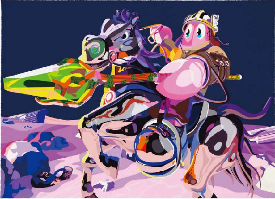
Philip Colbert, Battle for Lobsteropolis(Figure)XXI, 2025, Somerset 410gsm en satin, Deckled Edge, 74 x 100 cm, Edition of 25 plus 8 AP

기간 2026년 5월 7일 (목) - 6월 1일 (월) | 장소 클럽동 로비 | 문의 02 2250 8084, 8085