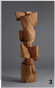
1 <김윤신: 합이합일 분이분일> 2층 전시 전경, 호암미술관, 2026. 사진 전명은, 호암미술관 제공. 2 김윤신, '노래하는 나무 2013-16/1', 2025, 알루미늄에 아크릴 물감, 135×202×56cm, 김윤신조형예술연구소 소장, 파주, ©Kim Yun Shin. 사진 전명은, 호암미술관 제공. 3 김윤신, '합이합일 분이분일(合二合一分二分一)' 1984~11', 1984~2011, 나무, 158×63×55cm, 개인 소장, ©Kim Yun Shin. 사진 전명은, 호암미술관 제공. 4 김윤신 '예감', 1967, 종이에 석판, 63.5×45cm, 개인 소장, ©Kim Yun Shin. 사진 최철림, 작가 제공.