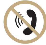
피트니스 내 전화통화 자제

피트니스 내에서 회원에게 강압적인 선물, 할인 등의 제안이나 다단계 홍보 유도는 절대 불허합니다.