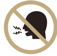
타인에게 불편함을 주는 고성 자제