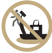
기구 선점 금지